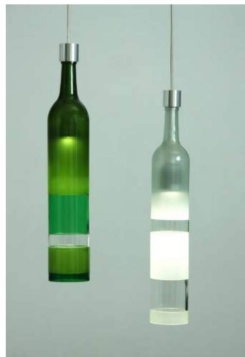
Sybille Homann, Flaschenleuchten . Glas, LED. Bottle Lamps , glass, LED.