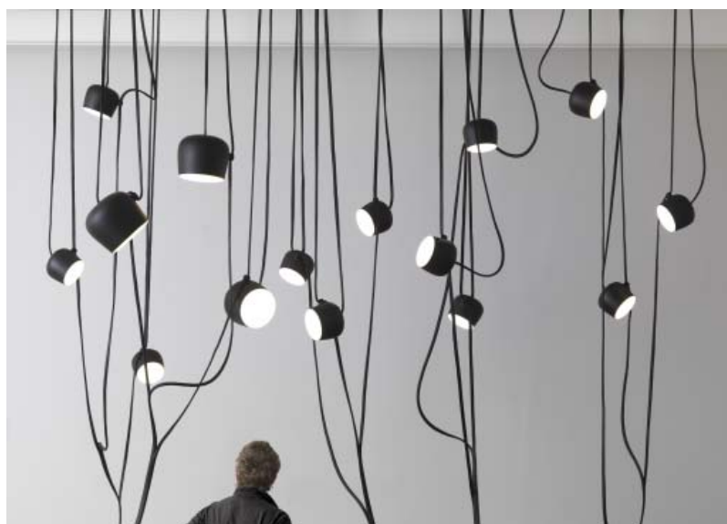
Ronan & Erwan Bouroullec für Galerie Kreo, Liane , Fiberglas, Corian, Leder. Fiberglass, Corian, leather.