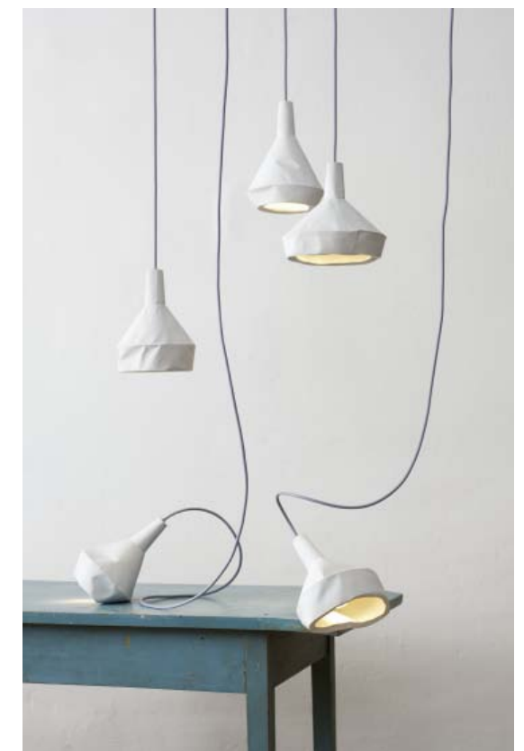
Aust & Amelung, Like Paper , Tischleuchte Table. Beton, E14 Reflektorspot. Concrete, E14 reflector spot.