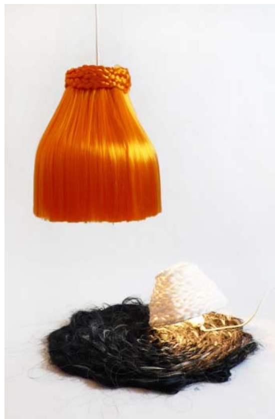
Milena Kraiss, Objektserie Kahl , Leuchte mit Zopftrand. Lamp with braided collar.